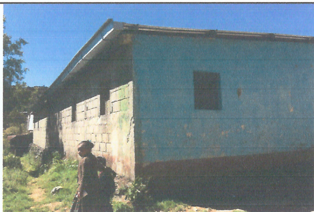
Foto 3: Modulo 1 en el cual se muestra el deterioro, en la parte externa