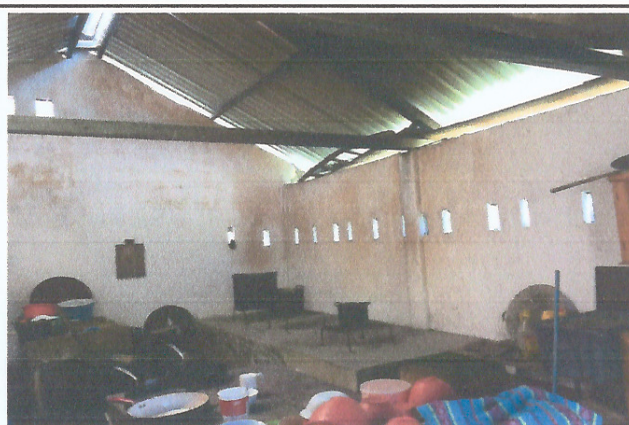
Foto 4: Modulo 2 vista de interior de cocina, con necesidad de extractor de humo.

Observación: Si es necesario se pueden agregar hojas adicionales y actualizar el número de hojas.